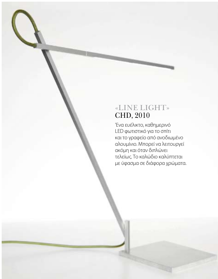
«LINE LIGHT» CHD, 2010

Ένα ευέλικτο, καθημερινό LED φωτιστικό για το σπίτι και το γραφείο από ανοδιωμένο αλουμίνιο. Μπορεί να λειτουργεί ακόμη και όταν διπλώνει τελείως. Το καλώδιο καλύπτεται με ύφασμα σε διάφορα χρώματα.