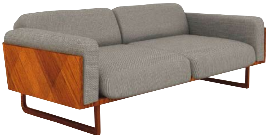
«BOIS» Han Yi, 2011

Για να γιορτάσει τα 30 χρόνια του, το πιο διαχρονικό περιοδικό σπιτιού στην Ελλάδα συναντά τους πιο πρωτοποριακούς Έλληνες σχεδιαστές. Με δράση στην Ελλάδα και το εξωτερικό, με δυνατές συνεργασίες και σημαντικές βραβεύσεις στο ενεργητικό της, η νέα γενιά του ελληνικού design είναι ο καλύτερος λόγος που έχουμε για να είμαστε αισιόδοξοι για το μέλλον. Επιμέλεια Ιωάννα Ζάγκα