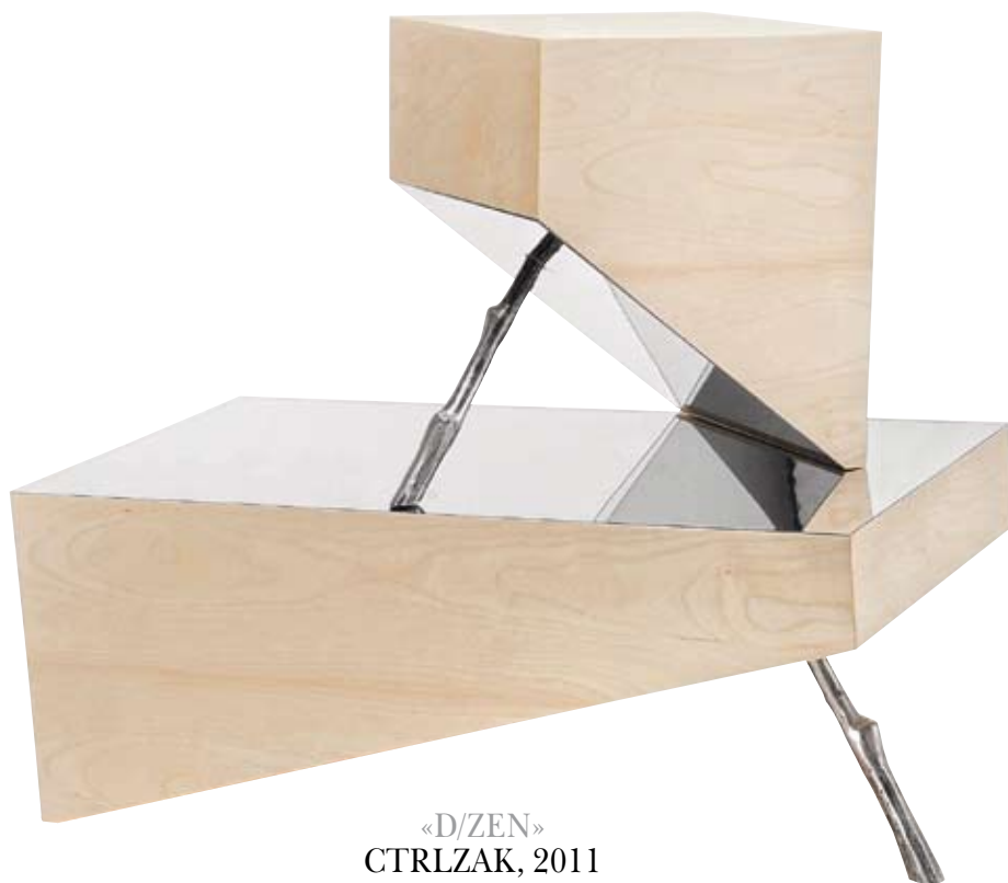
«D/ZEN» CTRLZAK, 2011

Οι CTRLZAK εμπνεύστηκαν από τους μεγάλους βράχους που στηρίζονται σε μικρά κλαδάκια που είδαν σε κάποιο ταξίδι τους στο εξωτερικό. Στη σειρά επίπλων «D/ZEN» το μικρό κλαδάκι είναι η ανθρώπινη συμβολή που στηρίζει τη φύση και ταυτόχρονα μας θυμίζει ότι όλα είναι προσωρινά.