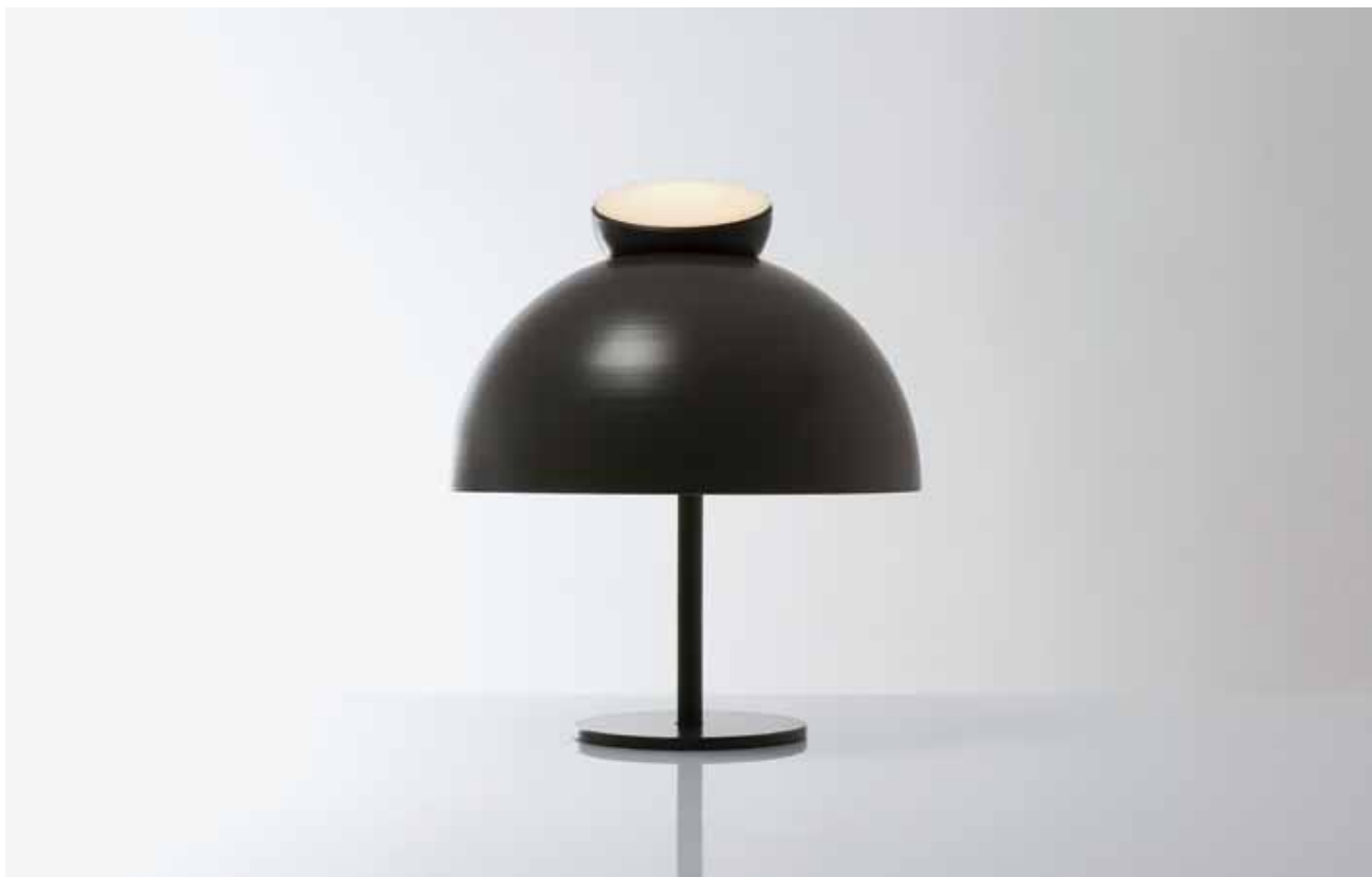
50. Επιτραπέζιο φωτιστικό Parasite (2011)