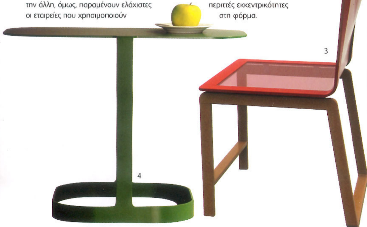
1. Έπιπλο για εφημερίδες και περιοδικά. 2, 4. Τραπεζάκια από λαμαρίνα. 3. Καρέκλα με διαφανές κάθισμα και πλάτη.